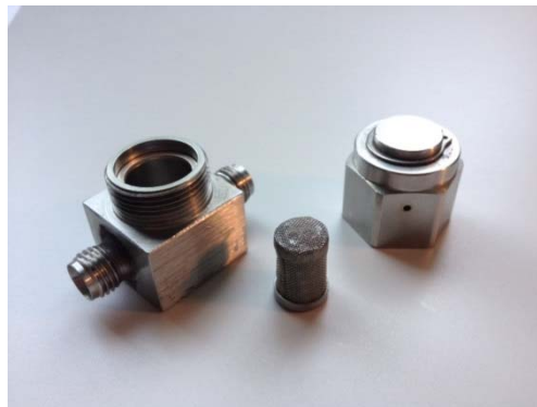
Fig 11 : filtre à huile