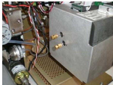
Fig 5 Bouchons de la zone chaude

10. Allumez le moniteur. Une fois la température du moniteur stabilisée, il reprendra sa planification d'échantillonnage normale.