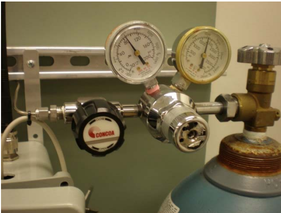
Fig 7 : régulateur Concoa

Si le régulateur d'hélium a besoin d'un ajustement, déterminez d'abord quel type de régulateur est présent, Concoa ou Airgas (Fig 7+8). Pour le modèle Concoa , soulevez l'étiquette Concoa noire et utilisez une clé Allen 3/16" pour tourner la vis à tête hexagonale dans le sens des aiguilles d'une montre afin d'augmenter la pression ou dans le sens inverse afin de la baisser. La pression côté inférieur (jauge de gauche) doit être ajustée à 82 psi . Pour le modèle Airgas , retirez l'écran borgne 3/4" pour exposer la vis à tête hexagonale et utilisez une clé Allen 1/4" pour ajuster la pression de la même manière à 80 psi sur la jauge de gauche.