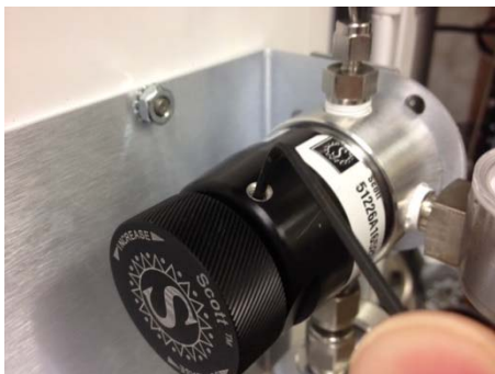
Fig 9 : vis du régulateur Scott