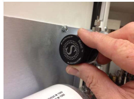
Fig 10 : bouton d'ajustement