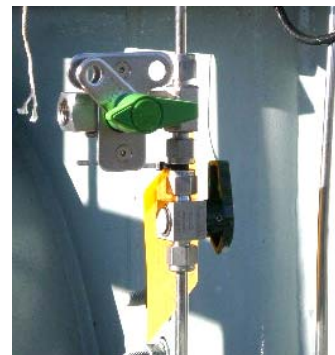
Fig 6 : port d'échantillonnage

NOTE : Laisser la valve d'arrêt secondaire du moniteur fermée résultera en un mauvais fonctionnement du moniteur.