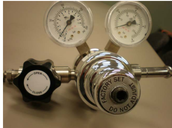
Fig 8 : régulateur Airgas

Si vous disposez d'un ordinateur portable avec Hyperterminal (ou toute autre application d'émulation de terminal), connectez-vous au port de service du moniteur à J11 sur la carte série avec le câble série et l'adaptateur et établissez une session CLI (Interface en lignes de commande) avec le moniteur. Une fois connecté, utilisez la commande pres pour démarrer une lecture avec défilement et en temps réel de la pression d'hélium. Regardez la colonne de gauche (pression d'hélium délivrée) pendant que vous tournez la clé Allen pour augmenter ou baisser la pression. Le changement de pression sera plus rapide quand vous augmenterez la pression et prendra plus de temps quand vous la baisserez. Pressez Ctrl + C pour arrêter le défilement, puis tapez exit si vous en avez fini avec la session CLI.